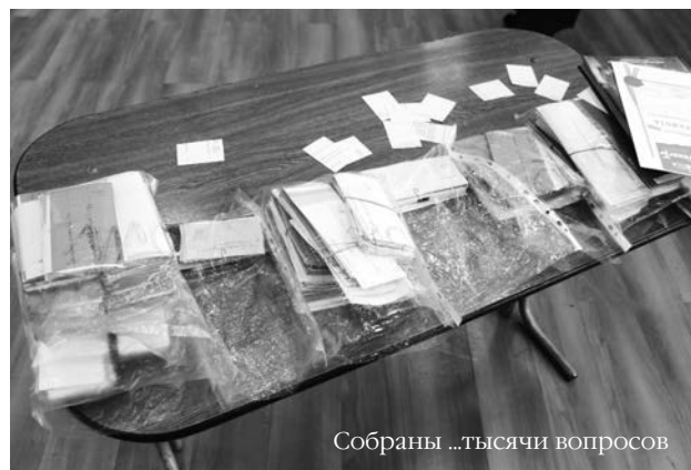
Собраны ...тысячи вопросов

Классы выходят в рекреацию около макета «Дома НИИЧаВо».