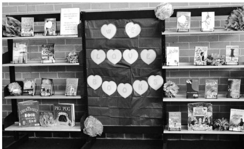
До встречи в следующий День библиотек в других странах!