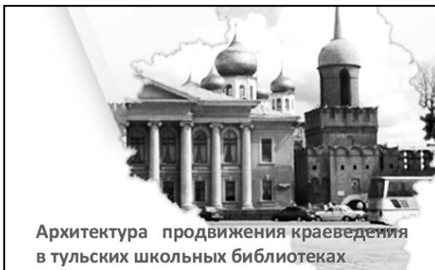
Архитектура продвижения краеведения в тульских школьных библиотеках