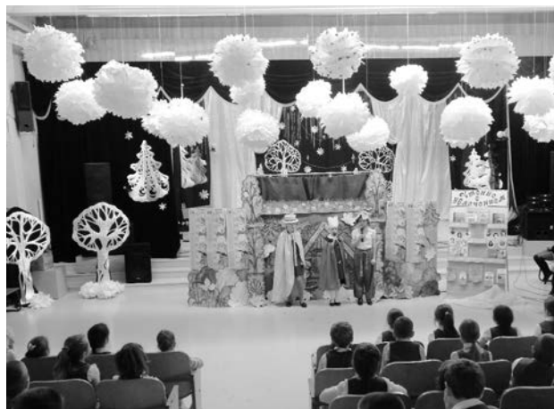
Театрализованное представление в актовом зале с героями БИБЛИОша и КНИЖина. МБОУ Лицей № 7