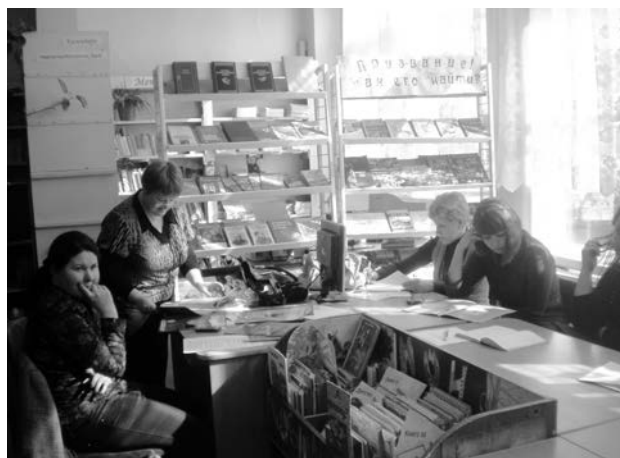
Заседание ГМО школьных библиотекарей

Совместно с ГМО учителей русского языка и литературы проведены конкурсы: городской литературный конкурс «Есенинские чтения – 2015»; городской литературный конкурс «Бунинские чтения – 2016»; муниципальный этап всероссийского конкурса юных чтецов «Живая классика».