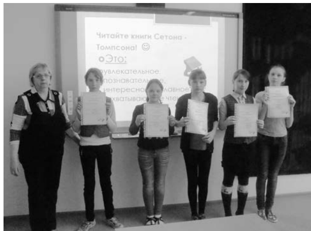
Защита проектов. Школьная библиотека МБОУ ЧСШ № 1

В МБОУ СОШ № 6 учителями создана творческая группа «Духовно-нравственное воспитание», в которой педагог-библиотекарь активно работает. Ежегодно в библиотеке оформляется «Календарь знаменательных дат», где экспонируются выставки книг и рисунков учащихся: «День защиты животных», «День толерантности», «Этикет дает ответ» и др. Проводятся беседы, познава-