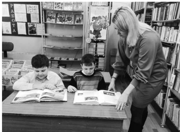
Школьная библиотека МБОУ СОШ № 6

«С книгой по свету!». Он состоит из четырех этапов и на каждом этапе обязательно проходит: