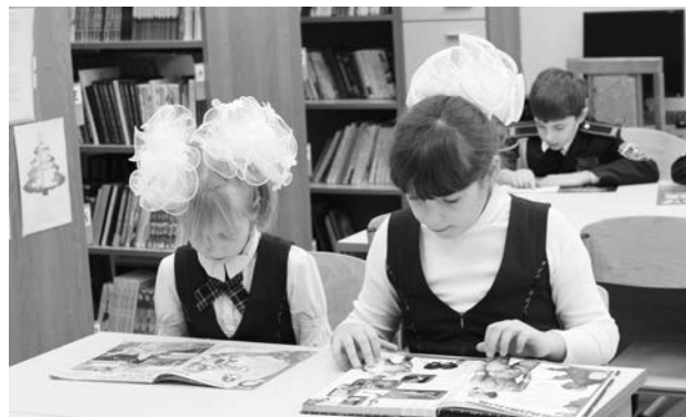
Библиотека МБОУ «Лицей “Эврика”»

В рамках реализации государственной политики в области чтения, программы начальной школы в области воспитания квалифицированного читателя библиотекари МБОУ Лицей № 7 поставили цель: укрепить читательскую среду ребенка за счет объединения усилий семьи, школы, библиотеки. С 2012/13 учебного года в Лицее работает проект