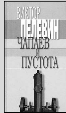
Виктор Пелевин «Чапаяев и Пустота» Издательство «Азбука- классика», 2015

Нет реальности, кроме той, которую мы носим в себе. Герман Гессе