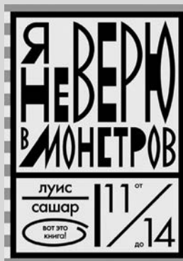
Луис Сашар «Я не верю в монстров»

Перевод с английского Евгении Канищевой Издательство «Розовый жираф», 2014