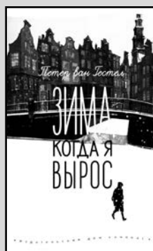
Питер ван Гестел «Зима, когда я вырос» Художник Юлия Блюхер Перевод с нидерландского Ирины Михайловой Издательство «Самокат», 2014

Книга Питера ван Гестела «Зима, когда я вырос» была с дефектом и стоила в три раза дешевле, чем остальные. Именно поэтому мама мне ее и купила. Из-за цены. Странными путями попадают к нам книги, которым суждено стать одними из самых любимых.