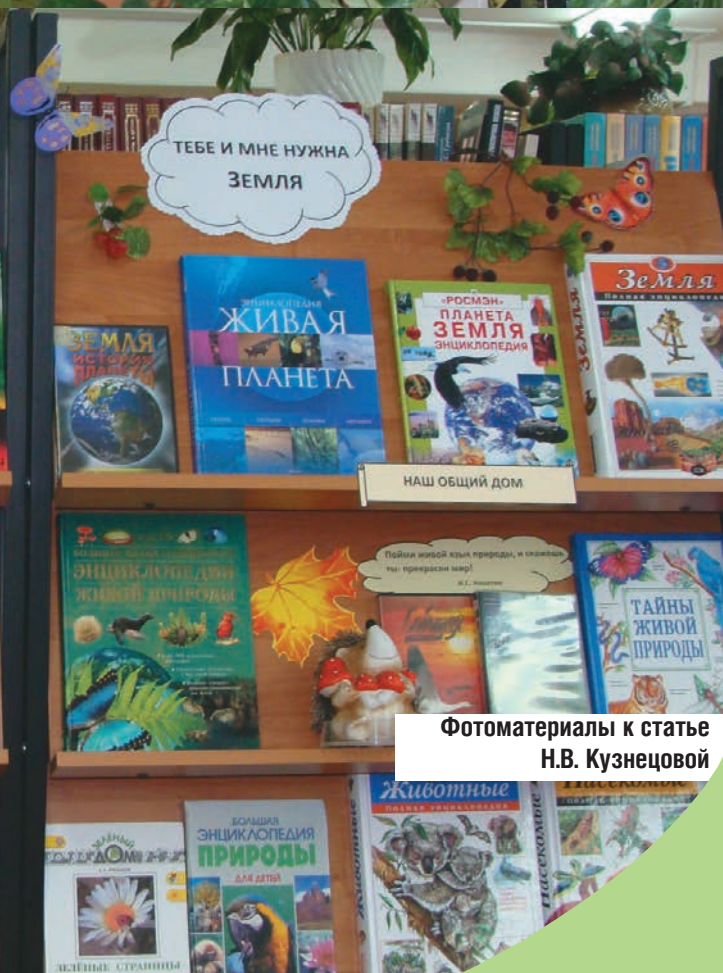
Фотоматериалы к статье Н.В. Кузнецовой